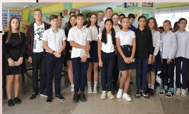
Благодарный зритель выставки: 10 и 7 классы.